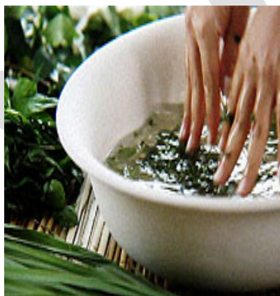
Banho de cheiro