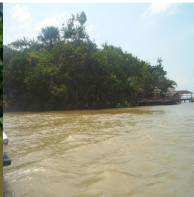
Contornando a ilha