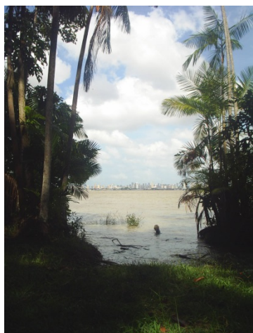
Belém ao fundo