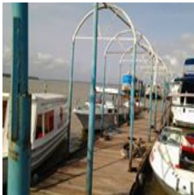
Saída dos barcos