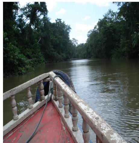
Passeio de barco pelos furos